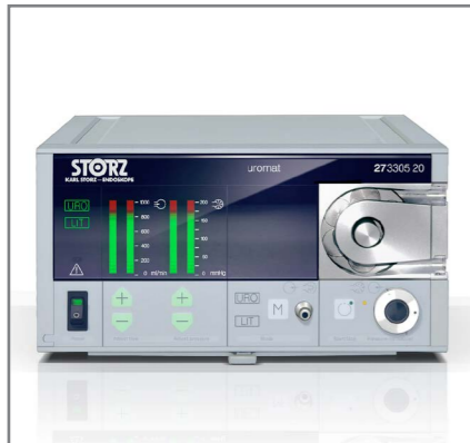
STORZ Operationseinheit Uromat