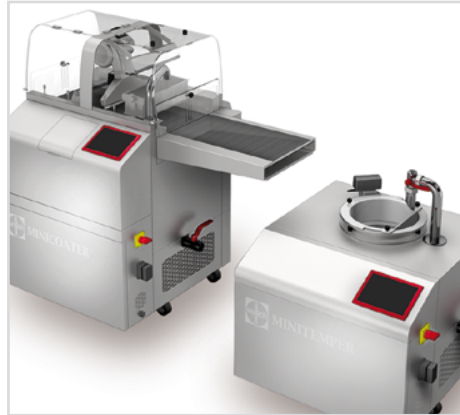
SOLLICH Minicoater und Minitemper