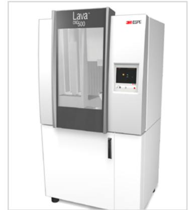
3M ESPE Lava CNC500