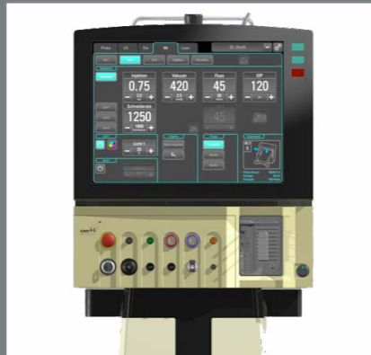
OERTLI Operationsplattform OS4