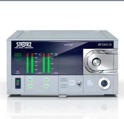
STORZ Operationseinheit Uromat